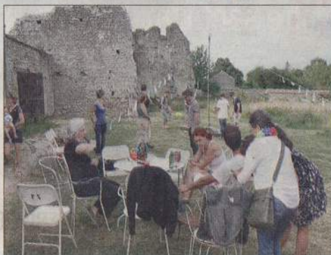
Pendant le pique-nique au pied des tours.

En partenariat avec l'union Rempart et 20 bénévoles venus des quatre coins du monde (Espagne, Maroc, Inde, Mali, Belgi-