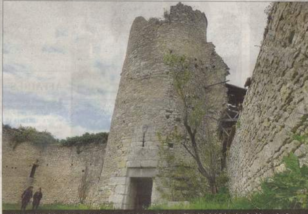
HISTOIRE. Détruit lors de la Guerre de cent ans, puis incendié avant d'être laissé à l'abandon, le château des Deux tours n'a jamais eu de chance. Mais devenu propriété d'une troupe de comédiens, il pourrait bien être sauvé.