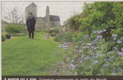
À PARTIR DU 4 JUIN. Ouverture permanente du Jardin des Minuits.

Au pied de l'ancestral château des Deux tours se trouve aussi le jardin du Théâtre des Minuits. Un hectare de nature subligné par de talentueux artistes que les visiteurs pourront bientôt découvrir. À partir du 4 juin, le site jusqu'à présent ouvert en de rares occasions s'ouvrira donc de façon permanente au regard des curieux. Pour le moins étonnant, le « jardin de l'imaginaire » de la troupe de comédiens se laisse apprécier à travers des visites guidées. Et mieux vaut être accompagné pour percer les mystères des lieux, comme celui de cette « forêt interdite », pour le dire autrement, de ce